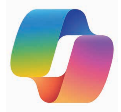
Microsoft Copilot Browser Edge